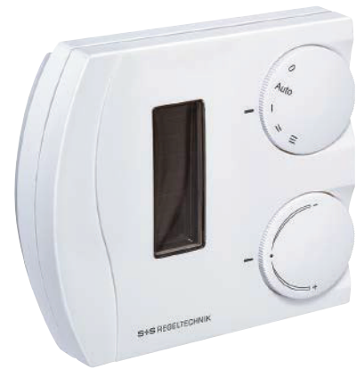
RTF 2 - FSE - PD RFTF 2 - FSE - PD

La sonde de température ambiante KYMASGARD® RTF 2 - FSE - PD ou RFTF 2 - FSE - PD est un émetteur radio fonctionnant sans pile et ne nécessitant aucune maintenance. L'énergie est produite par la conversion de la lumière ambiante intérieure en énergie électrique, au moyen d'un générateur solaire. Elle est destinée à mesurer la température ambiante et l'humidité ambiante et à régler la valeur de consigne, et à les transmettre par radio vers des actionneurs radio et des récepteurs radio / passerelles. Si la lumière ambiante est trop faible pour générer l'énergie nécessaire, elle peut également fonctionner à l'aide d'une pile lithium. Pour cela, on devra insérer la pile lithium dans le logement prévu à cet effet. L'ID de l'appareil est mentionné sur une étiquette à l'intérieur de l'appareil.